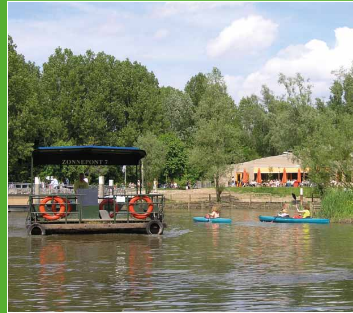
① Biesboschcentrum Dordrecht

Op verschillende plaatsen in de Biesbosch varen rondvaartboten op zonne-energie. Ze vertrekken vanuit de bezoekerscentra in Dordrecht en Drimmelen en vanuit het Biesbosch Museum in Werkendam. Ook zijn op veel plaatsen fluisterbootjes te huur.