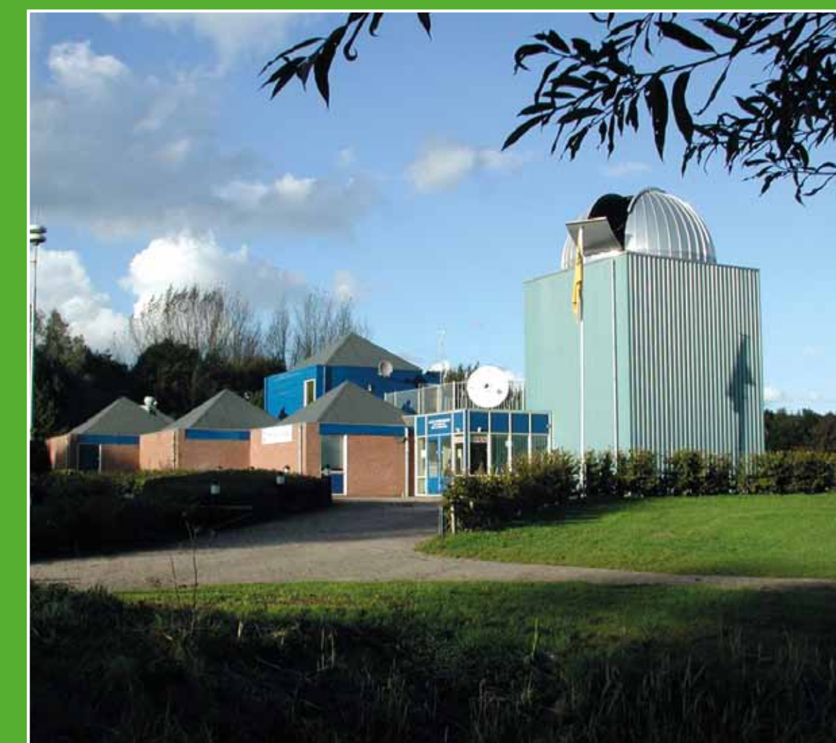
④ Sterrenwacht Mercurius

In het Biesbosch Museum staan het verleden, heden en de toekomst van de Biesbosch centraal. Daarnaast is het museum een prima uitvalsbasis voor een rondvaart met een fluisterboot en vertrekpunt voor wandelingen variërend in lengte van 2 tot 20 kilometer. Adres: Hilweg 2, Werkendam.