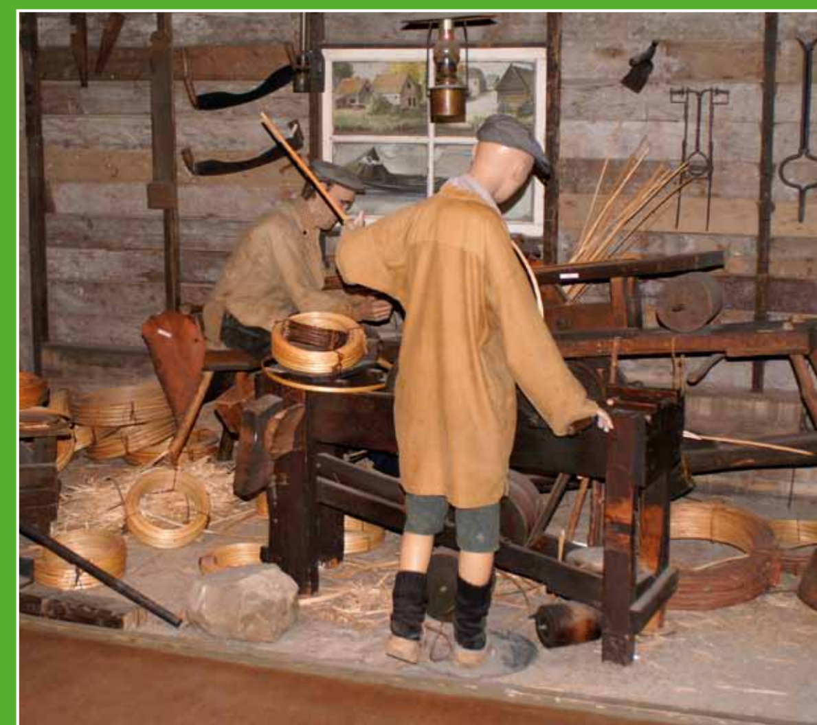
③ Biesbosch Museum

De afgelopen jaren is een groot landbouwgebied omgetoverd in een schitterend waterrijk natuurgebied waar rivierwater de ruimte krijgt. Het weidse Biesboschlandschap maakt het gebied aantrekkelijk voor zowel wandelaars als fietsers. Veel verschillende soorten (zeldzame) vogels kunt u spotten in de Kleine Noordwaard. Ook landschapskunstwerk 'De Wassende Maan' is het bezichtigen waard.